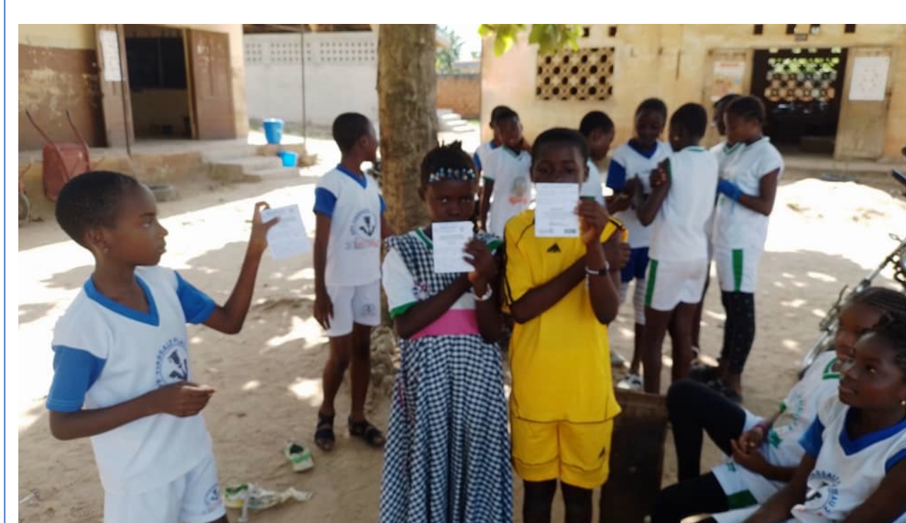
Vaccination en milieu scolaire, District sanitaire Tiassalé

“Services de Santé Scolaire et universitaire offerts en Côte d'Ivoire”