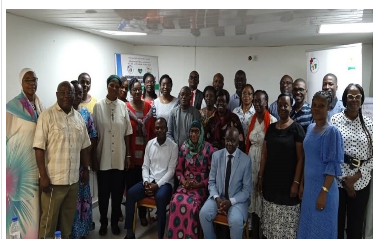
Atelier de révision des outils de visite médicale systématique, du monitoring, de la supervision pour la prise en compte de la vaccination contre le HPV