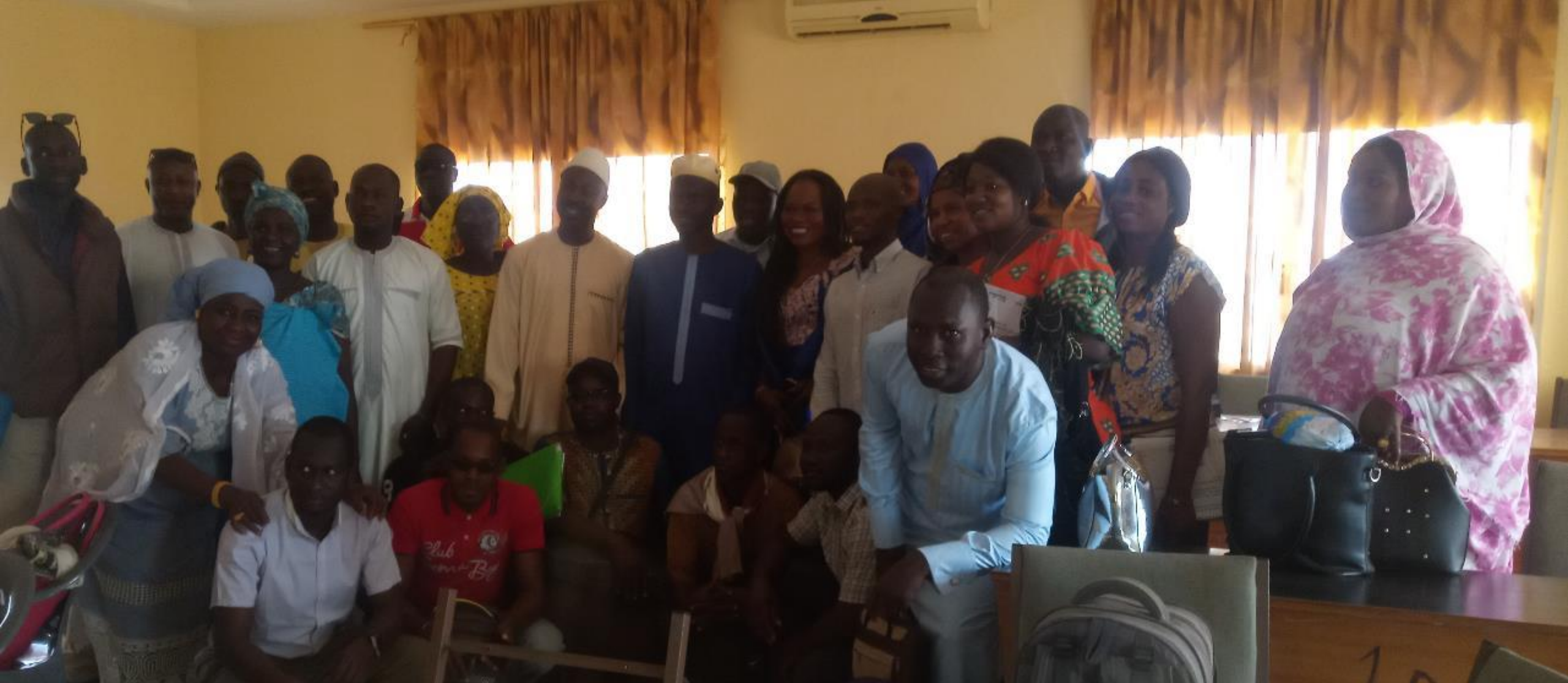
Formation des Collectifs des Directeurs d'Ecole (CODEC)