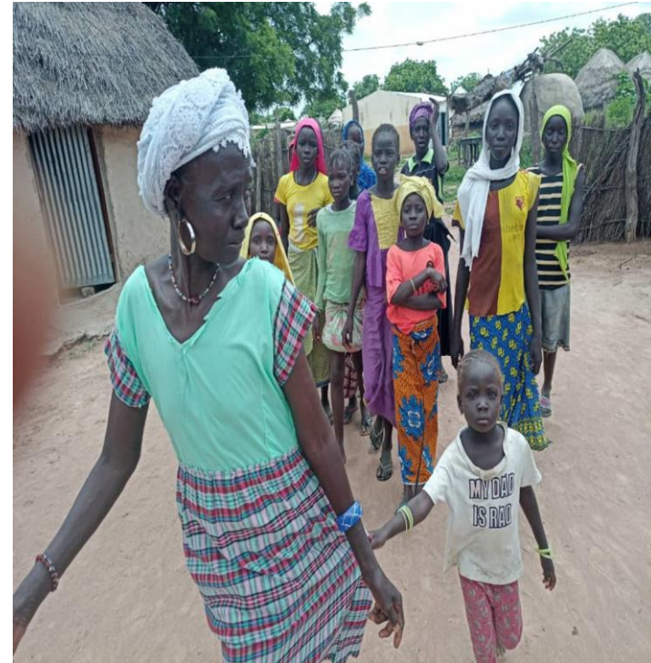
Marraine de quartier faisant sortir les filles à vacciner village de Dimbo (Tambacounda)