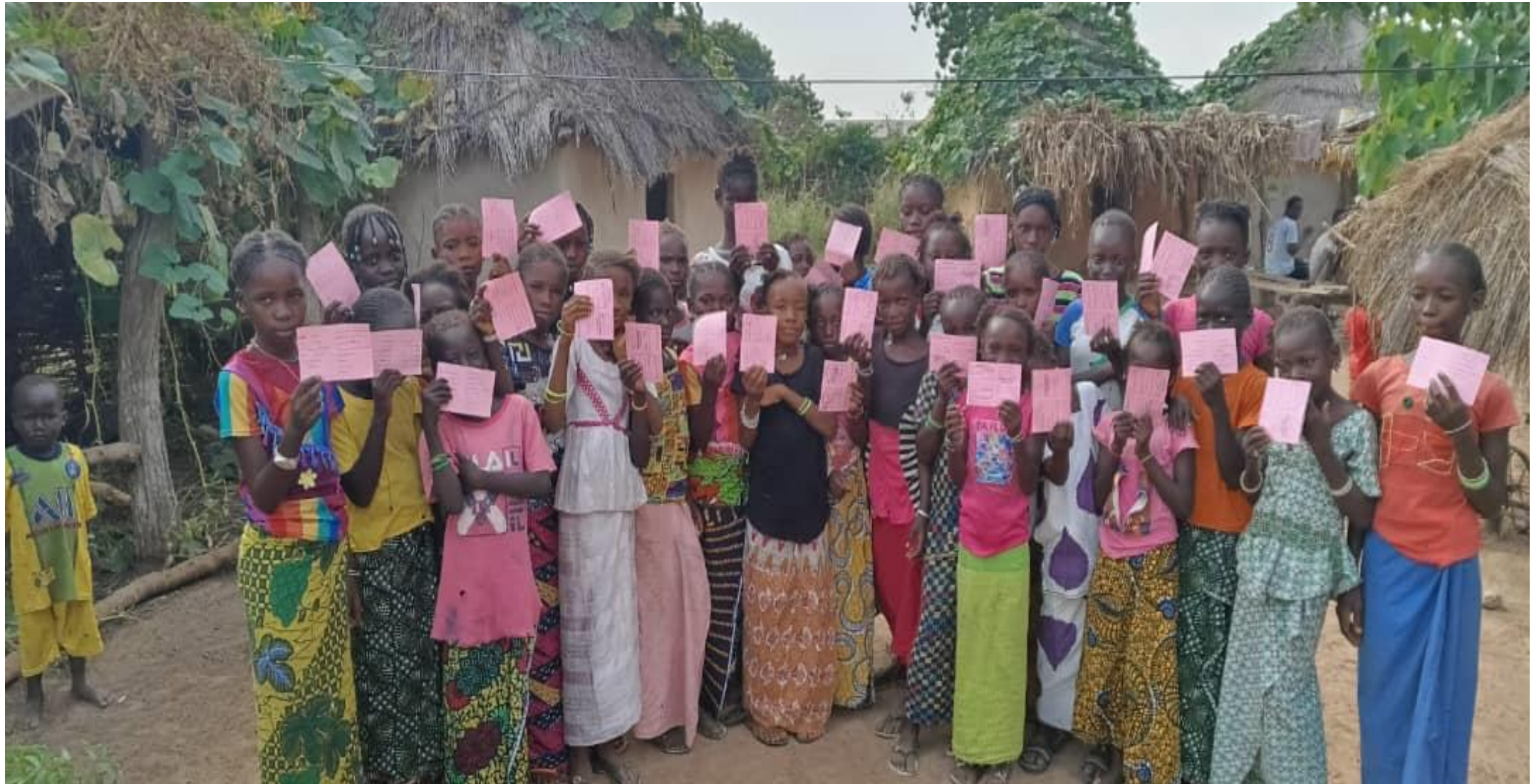
Filles vaccinées au HPV à Marsine , PS DAWADY exhibant leur cartes avec fierté